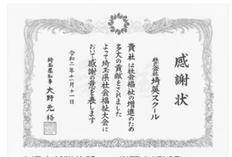
↑児童養護施設への学習支援活動で、埼玉県知事より感謝状を頂きました。

保護者のいない児童、ご家族の病気など、さまざまな理由により、ご家庭で暮らすことが困難な児童、その他環境上養護を要する児童を入所させて、これを養育し、あわせて退所した者に対する相談、その他の自立のための援助をおこなうことを目的としている施設です。彩の国総合教育研究所を通じて、サイエイの社員講師有志が令和2年4月から、小学生・中学生の入所者に学校の勉強の補習や、進学に向けての学習補助・支援を行っています。